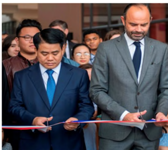
Le Premier Ministre français, M. Edouard Philippe et le Président du Comité Populaire d'Hanoï M NGUYEN Duc Chung

Hanoï, le 2 novembre 2018 - À l'occasion du double anniversaire des 45 ans des relations diplomatiques et des 5 ans du partenariat stratégique entre la France et le Vietnam, le Premier Ministre Édouard Philippe a effectué une visite officielle au Vietnam du 2 au 4.11.